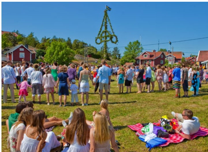
Midzomerfeest in Zweden

anderen (sociaal) en een bewuste omgang met de natuur (ecologisch). Zo hebben bijna alle Zweden oog voor het milieu: 95% van de inwoners maakt zich zorgen over de mondiale klimaatverandering. Als verklaring voor de Zweedse mentaliteit wordt vaak gewezen op de traditionele levensfilosofie van lagom , letterlijk 'precies zo veel als nodig is'. Lagom gaat over het streven naar een balans in alles wat je doet, zeg maar het zoeken naar de gulden middenweg.