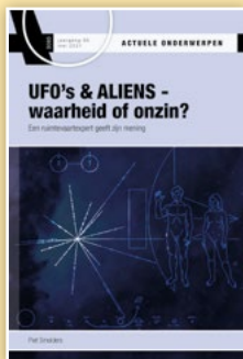
AO 3085 UFO's & ALIENS - waarheid of onzin?