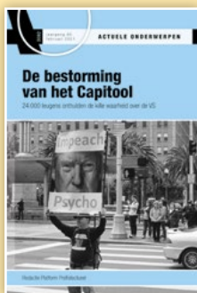
AO 3082 De bestorming van het Capitool

Kijk op onze website voor abonnementen en losse uitgaven: www.actueleonderwerpen.nl