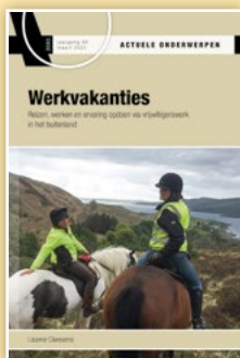
AO 3083 Werkvakanties